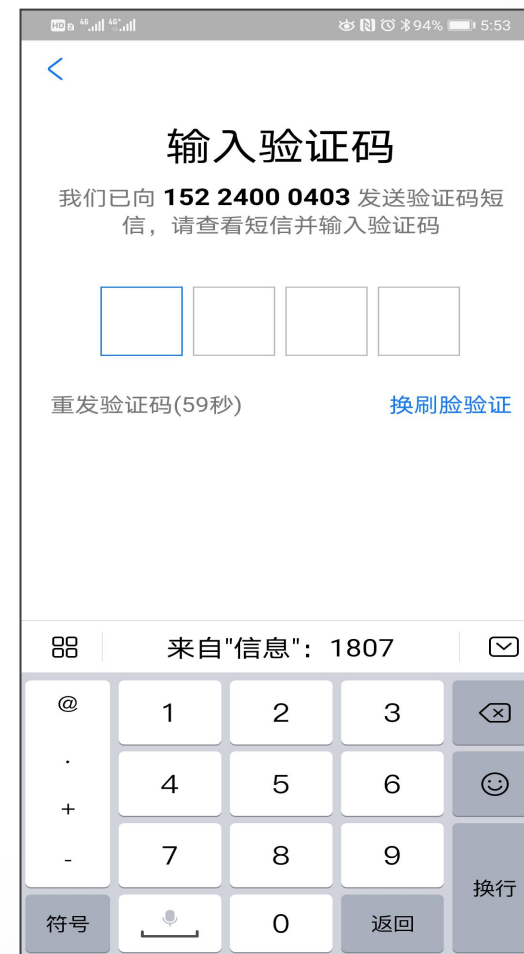
输入验证码完成注册