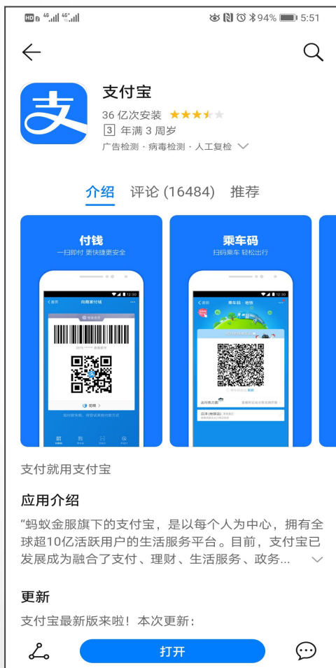
应用市场搜索支付宝并下载