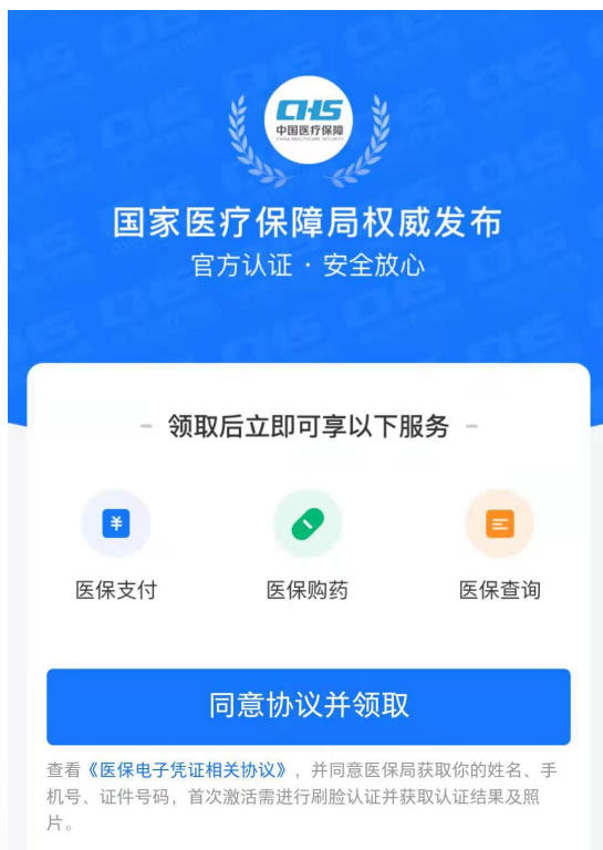
领取医保电子凭证